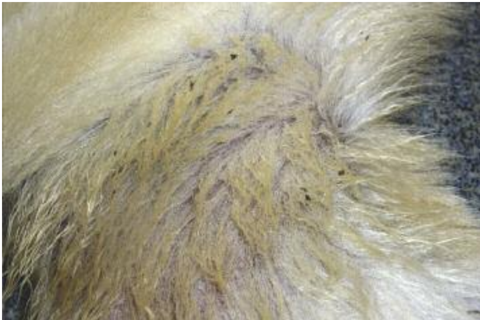
Schwarze Schuppen bei der Ichthyose des ausgewachsenen Retrievers

thyose, leiden. Während andere Ichthyosen mit schweren Hautentzündungen einhergehen können und im schlimmsten Falle lebensbedrohlich verlaufen, ist die Fischschuppenkrankheit der Golden Retriever eher harmlos, denn die Hautveränderungen sind nur oberflächlich. Tiere mit nicht-epidermiolytischer Ichthyose weisen große, meist dunkle Schuppen an Brust, Bauch oder Flanken auf. Weitere Beschwerden treten in der Regel nicht auf. Die gestörte Verhornung kann jedoch die Hautbarriere beeinträchtigen. Infolgedessen kann die Haut anfälliger für entzündliche Reaktionen zum Beispiel durch Infektionen mit Pilzen oder Bakterien sein.