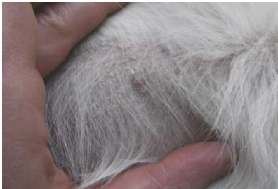
Feine Schüppchen am Bauch eines Welpen

Golden Retriever Welpen haben manchmal einen schuppigen Ausschlag im Bereich des Bauches, der von Züchtern auch Milchschorf genannt wird. Der Ausschlag juckt und schmerzt nicht. Nach einiger Zeit verschwindet er meist von alleine. Ursache und Folgen des Milchschorfs für die zukünftige Hautgesundheit waren bislang nicht bekannt. Ausgewachsene Golden Retriever können unter einer Form der Fischeschuppenkrankheit, der nicht-epidermiolytischen Ich-